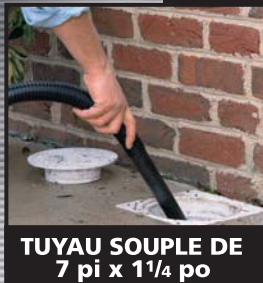
TUYAU SOUPLE DE 7 pi x 1 1/4 po