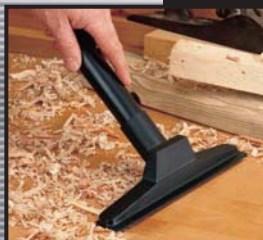
EMBOÛT COMBINÉ AVEC RACLETTE DE 10 po x 1 1/4 po