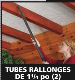
TUBES RALLONGES DE 1 1/4 po (2)