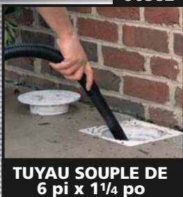
TUYAU SOUPLE DE 6 pi x 1 1/4 po