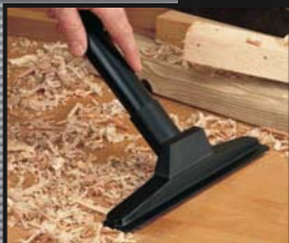
EMBOÛT COMBINÉ AVEC RACLETTE DE 10 po x 1 1/4 po