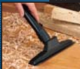
EMBOUT COMBINÉ AVEC RACLETTE DE 10 po x 1 1/4 po