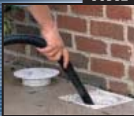
TUYAU SOUPLE DE 7 pi x 1 1/4 po